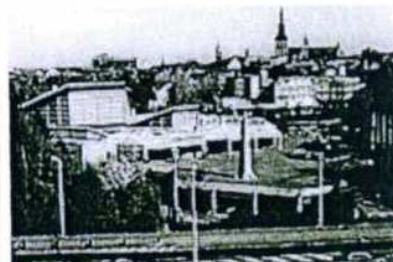
Dumeklemmerhalle - Stadthalle Ratingen Schützenstrasse 1 40878 Ratingen